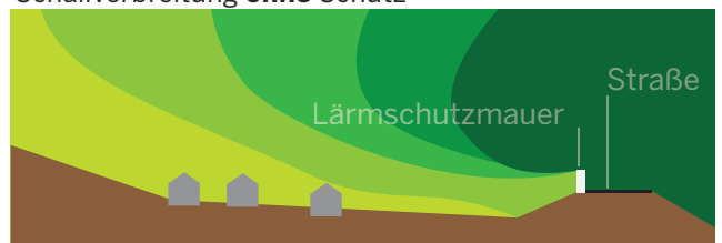
Schallverbreitung mit Schutz